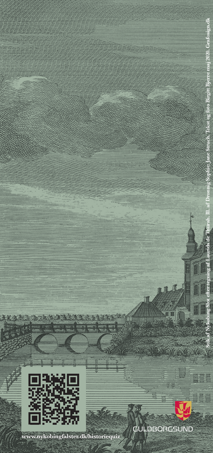
Skitse af Nykøbing Slot efter tegning af Laurids de Thurah. II. af Dronning Sophies betalt og foto Birgit Bjerre maj 2020. Grafosgen.dk